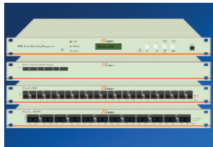
Zentralsysteme FiberCon 24 FiberCon 12/1200 SX FiberCon 1200 DS FiberCon 2400 FiberCon ANM FiberCon BPS