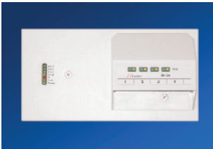
Einbausysteme CopperSwitch 100 BM+ FiberSwitch 100 BM+ FiberSwitch 1000 BM+ GigaSwitch BM+