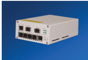
Desk Systeme CopperSwitch 100 BM+ (I) af Desk FiberSwitch 100 BM+ (I) af Desk DualSwitch 100 BM+ (I) af Desk DualSwitch 1000 BM+ (I) af Desk