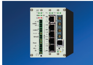
Industriesysteme iFiberCon 211 iFiberCon 422 iSwitch 540 iSwitch 740 iSwitch 741 iSwitch 742