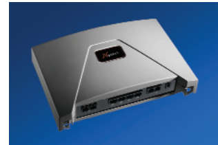
FTTx Systeme CPE CPE SIP Fiber Termination Unit