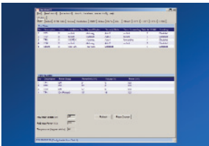
Software NexMan V3